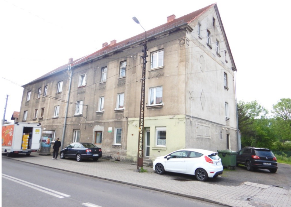
Ogólny widok budynku

na sprzedaż lokalu mieszkalnego Nr 7 znajdującego się w budynku położonym w Lubaniu przy ul. Leśnej 38A wraz z udziałem we współwłasności nieruchomości gruntowej (działka nr 85, AM 16, Obręb V o powierzchni 190 m 2 , JG1L/00015987/0)